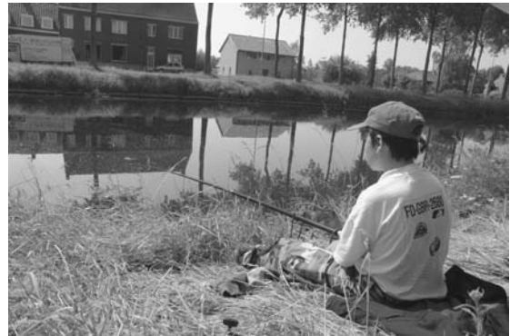
Hengelen langs de Damse Vaart

De zones waar met dit toegangsbewijs mag gehengeld worden zijn de westelijke oever van het Boudewijnkanaal tussen de Herdersbrug en Zwankendamme, en het Verbindingsdok langsheen de Kiwiweg.