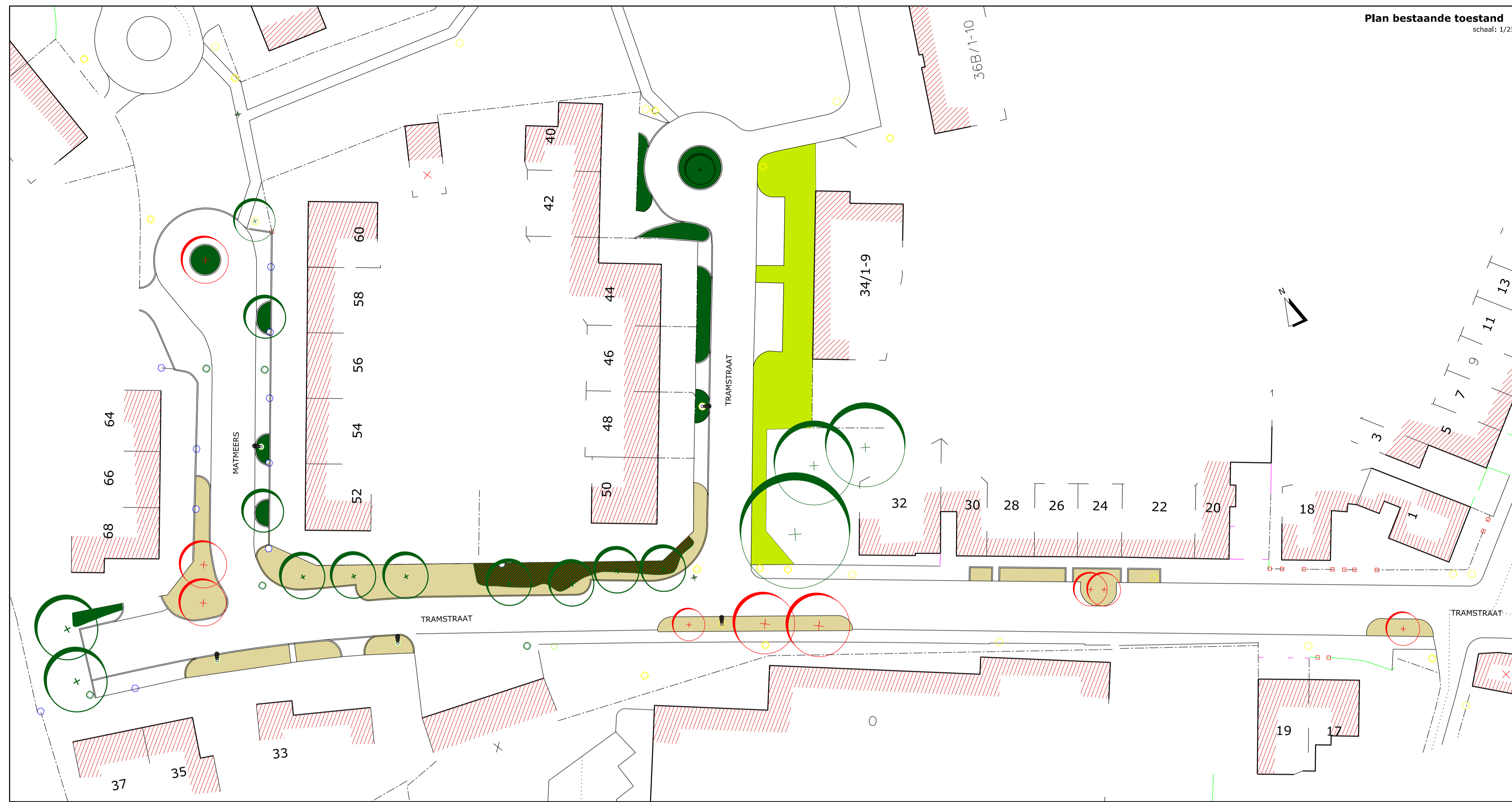
Plan bestaande toestand