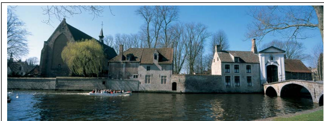
Zie hier een van de foto's die je kan downloaden van op http://foto.brugge.be